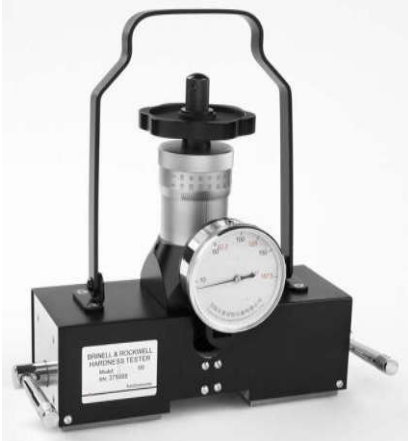
Standaard magnetisch uitvoering

Met de magnetische tester is er een uitvoering voor alleen Rockwell of Brinell én Rockwell.