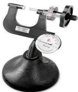
Tester en bijgeleverde standaard